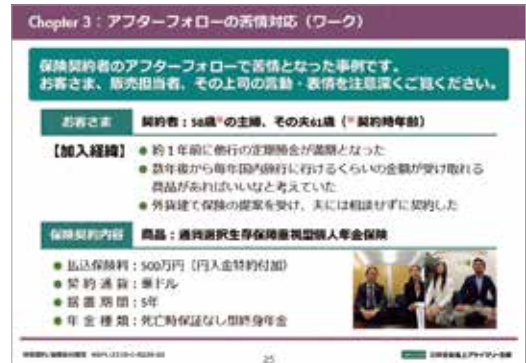
研修テキストイメージ