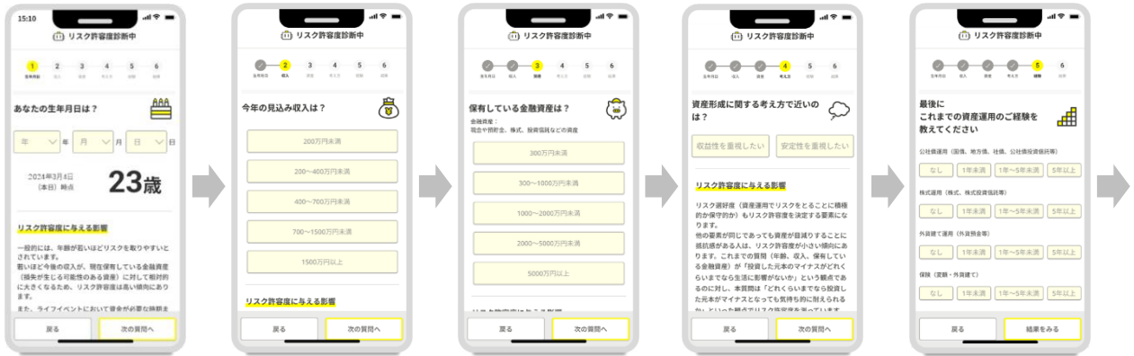
①生年月日 ②見込み収入 ③保有している金融資産 ④資産形成に関する考え方 ⑤資産運用のご経験