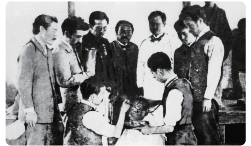
磐梯山噴火において救護活動を行う 日赤医療救護班

現在は、各都道府県に支部、病院、血液センター等を有し、社会の課題や期待に対応し、世界190以上の国と地域に広がる国際赤十字のネットワークとこれまで培った知見を生かし国内外で幅広い支援活動を行っています。