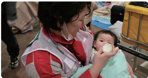
東日本大震災：拠り所となった石巻赤十字病院で 子供にミルクをあげる日赤助産師