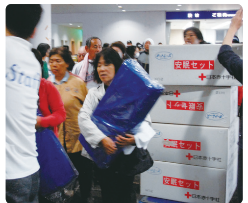
避難所において被災者へ安眠セットを配付

防災知識と行動力を学べる教材が国内の学校に届けられます。学校・地域・家庭において、子どもたちに防災・減災の担い手として主体的に行動してもらえるようになります。