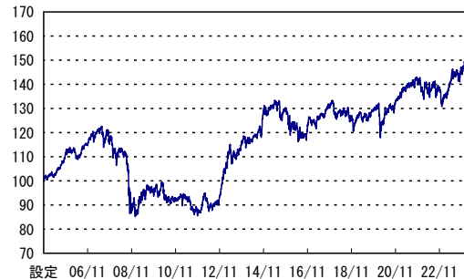
設定 06/11 08/11 10/11 12/11 14/11 16/11 18/11 20/11 22/11 ※横軸の目盛は該当月の25日を示します。