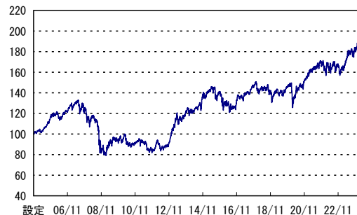
設定 06/11 08/11 10/11 12/11 14/11 16/11 18/11 20/11 22/11 ※横軸の目盛は該当月の25日を示します。