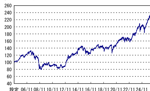
設定 06/11 08/11 10/11 12/11 14/11 16/11 18/11 20/11 22/11 24/11 ※横軸の目盛は該当月の25日を示します。