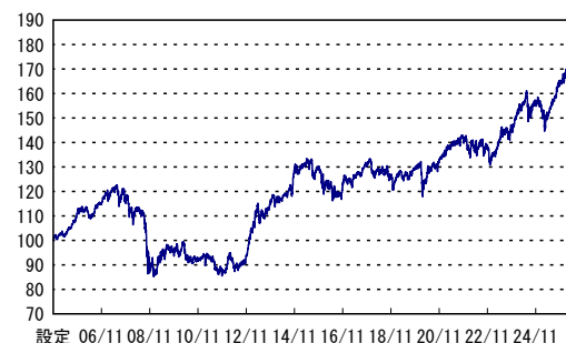
設定 06/11 08/11 10/11 12/11 14/11 16/11 18/11 20/11 22/11 24/11 ※横軸の目盛は該当月の25日を示します。